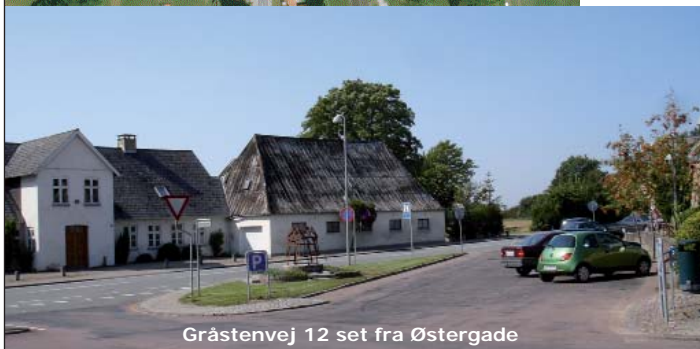
Gråstenvej 12 set fra Østergade

Begge grupper drøfter ideer til små hurtige projekter, der kan iværksættes straks og som giver stor effekt. Disse behøver ikke at ligge indenfor gruppens område.